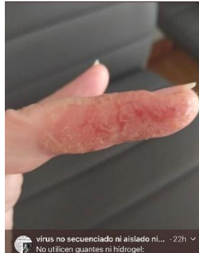
Protección de las manos: complemento ideal de las mascarillas