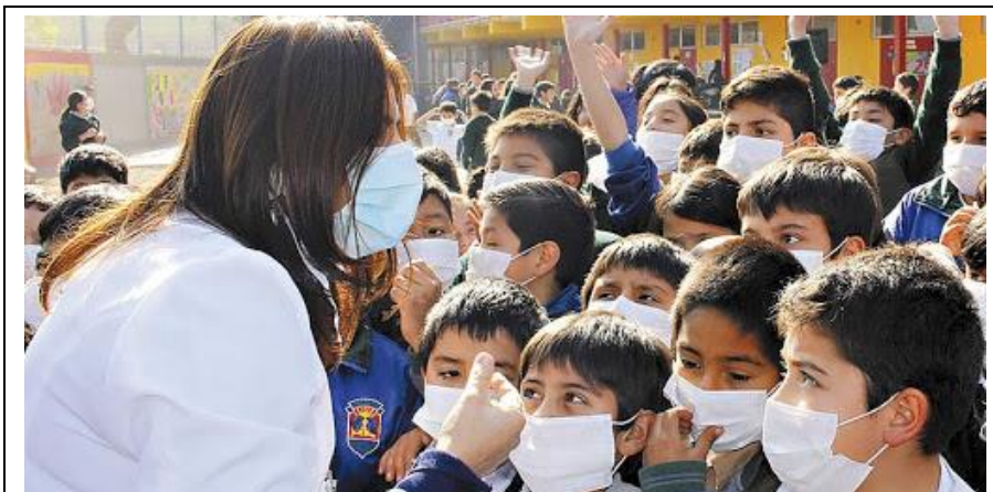
Uso de mascarillas: un ataque directo a la salud y al correcto desarrollo fisiológico e intelectual de los niños y niñas

Lo que sí existen son multitud de evidencias de que el uso prolongado de mascarilla provoca daños graves o fatales, entre ellos los asociados a los órganos más sensibles a deficiencias de oxígeno: cerebro (ictus, dolor de cabeza, desmayo con posible traumatismo), corazón (cardiopatías, infartos) y tejidos intersticiales (tumores).