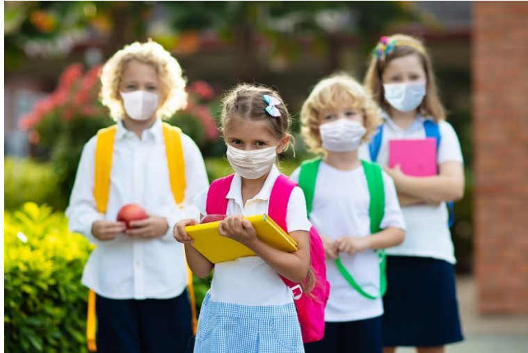
Una persona que respira a través de mascarilla recibe un 20 por ciento menos de oxígeno en cada inspiración, oxígeno que no puede utilizar su cerebro, ni sus pulmones, ni su metabolismo. En edades escolares y juveniles, este déficit causará estragos en su crecimiento y desarrollo

No hay evidencia científica de la eficacia de las mascarillas contra la transmisión de virus por el aire, pero sí hay evidencia científica de los peligros de usar mascarillas.