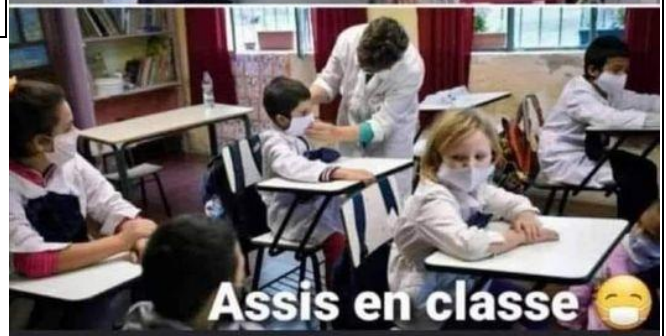
Distancia social: complemento ideal de las mascarillas y los hidrogeles para nuestra completa “protección”